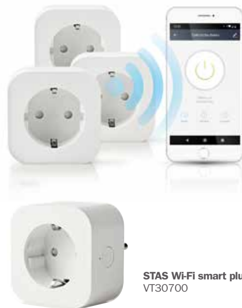
STAS Wi-Fi smart plug VT30700