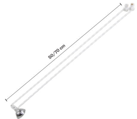
STAS multirail armatuur classic wit VA10500 50 cm VA10700 70 cm