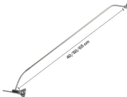
STAS multirail armatuur sirius chroom VA30365 40 cm VA30465 50 cm VA30665 65 cm