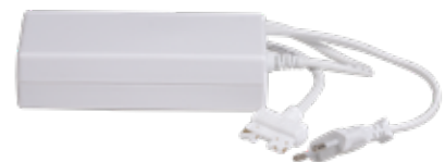
STAS multirail adapter 96 W VT20300