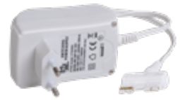
STAS multirail adapter 18 W VT20500

Bekijk de onderstaande tabellen voor de juiste keuze.