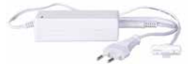
STAS multirail adapter 36 W VT20036