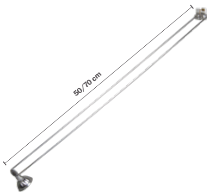
STAS multirail armatuur classic chroom VA30500 50 cm VA30700 70 cm